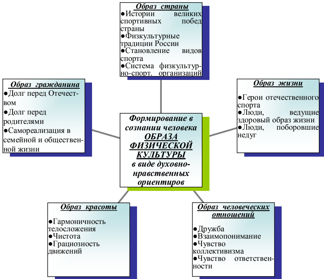
Рис. 1. Формирование в сознании человека образа физической культуры в виде духовно-нравственных ориентиров

Познавая историю великих героических спортивных побед соотечественников, знакомясь с персоналиями-носителями физической культуры, дети младшего школьного возраста начинают воспринимать физическую культуру не только как средство обеспечения своего физического развития, но и как общечеловеческую ценность, определяющую жизнь человека во всех ее проявлениях. Все это является действенным фактором формирования ценностных отношений личности к физической культуре.