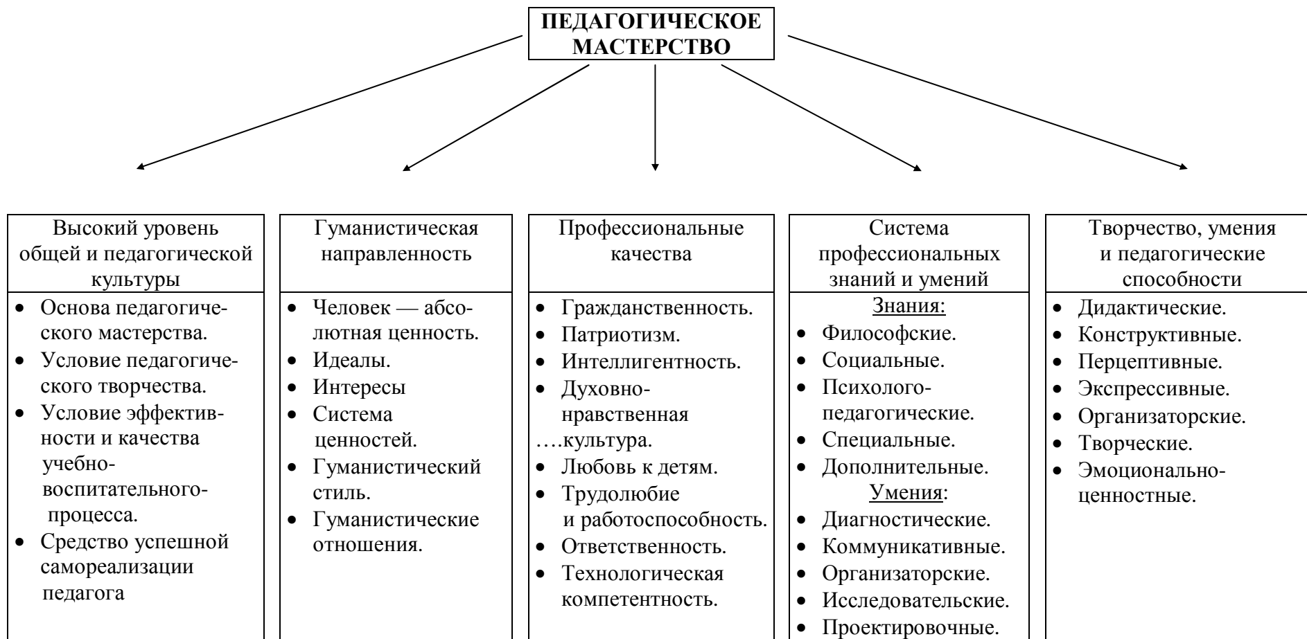
Рис. 2. Структура педагогического мастерства