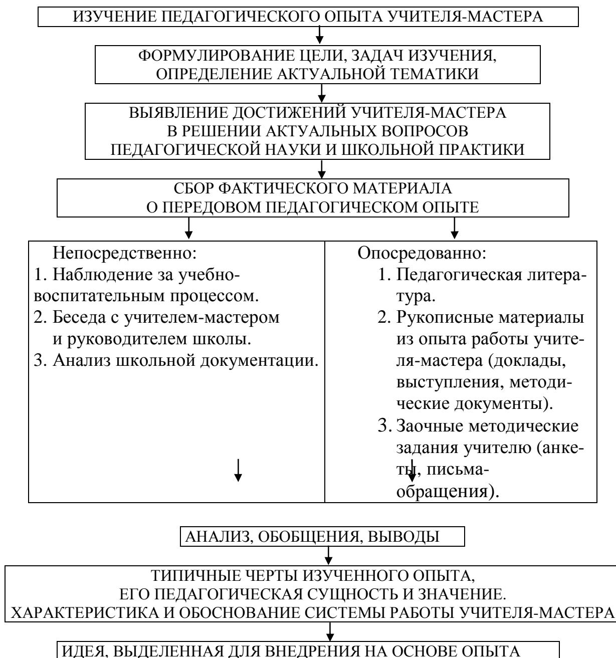
Рис. 1. Технология изучения передового педагогического опыта

Передовой педагогический опыт в любом случае связан с творчеством и является результатом творческого труда педагогических коллективов или отдельных учителей.