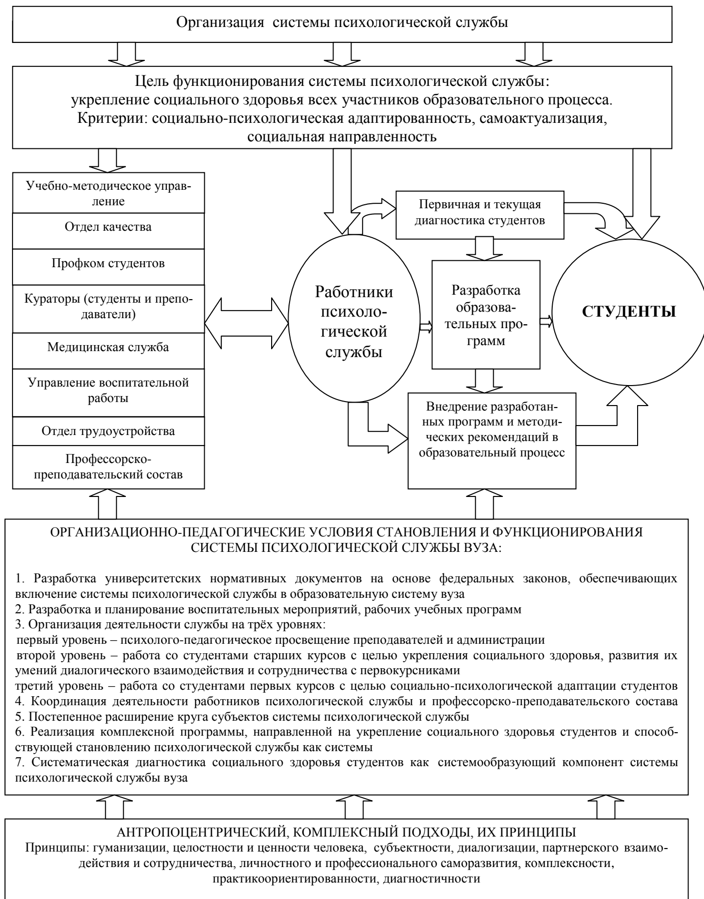
Рис.1. Теоретическая модель становления и функционирования системы психологической службы вуза